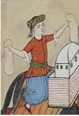
Fırıncı Esnafı (Levni)