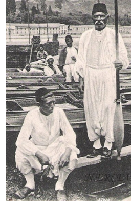
Kayıkçı Esnafı (Abdullah Biraderler)

Osmanlı dönemi çömlekçi esnafını konu alan şekil 13 Osman Hamdi Bey ve Marie De Luanay'ın bir çalışması olan "1873 Yılında Türkiye' de Halk Giysileri Elbise-i Osmaniye" den alınmıştır. Çömlekçi esnafı şekil 13'de üst beden giysisi olarak içte sıfır yakalı, bir mintan ile görülmektedir. Mintanın ön ortasına ilik düğme ile bir kapama yapılmıştır. Mintan bele bağlanan kalın ve desenli peştamalin içerisine