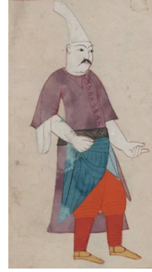
Aşçı Esnafı (Claes Ralamb)

Fırıncı esnafını konu alan şekil 1'de Osmanlı dönemi şenlikleri resmedilmiştir. Bu minyatür çalışmasında esnaf, mesleğini icra ederken