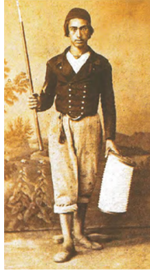
Bekçi Esnafı (Abdullah Biraderler)