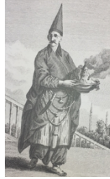
Helvacı Esnafı (Marie-Gabriel-Florent Auguste de Choiseul-Gouffier)