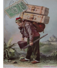
Hamallar Esnafı (Max Fruchtermann)