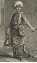
Berber Esnafı (Jean-Baptiste Van Mour)